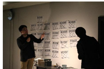
講師も含めてディスカッション