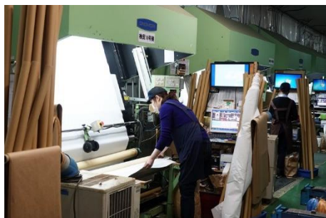
織物工場での作業の様子

自社のホームページにて、生産の過程や生産者へのインタビューを掲載して生産過程の見える化を行っています。