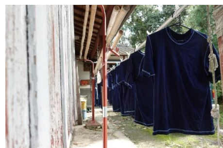
藍染めした衣類を乾かす様子