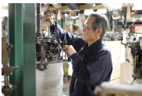
編み機での作業の様子