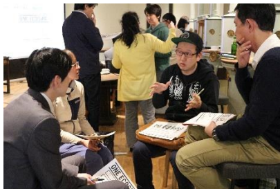
参加者同士のディスカッション