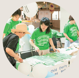
お店から売り上げの一部を寄付！