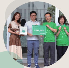
寄付金をチャイルド・ケモ・ハウスへ