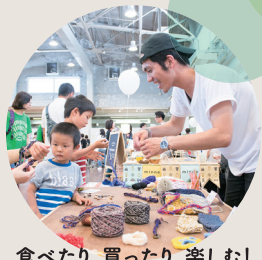
食べたり、買ったり、楽しむ！ チャイルド・ケモ・ハウスを知る！