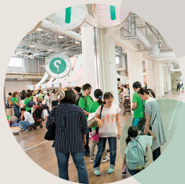
KIITOマルシェに遊びに来る！

KIITOの人気イベント「KIITOマルシェ」は、今年で6回目を迎えます。生糸検査所時代の趣が残る約1,000㎡の大空間に、神戸のクリエイターたちによる、子どもも大人も楽しめるワークショップや商品、飲食の販売など、約40店舗が並ぶ、1日限りのチャリティ・マルシェ・イベントです。売上の一部は、ポートアイランドにある、難病とたたかう子どもと家族のための療養施設「チャイルド・ケモ・ハウス」の活動に寄付します。ぜひ会場へお越しください！