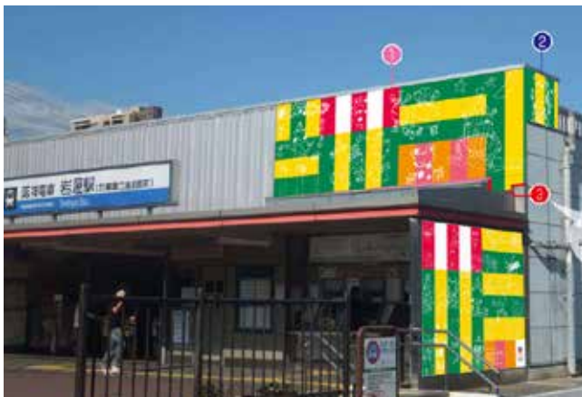
駅舎装飾完成イメージ図

1982 年神戸生まれ。大阪デザイナー専門学校卒業。数社のデザイン制作会社を経て、2006 年に株式会社キュービックデザインの立ち上げに参加。グラフィックデザインを中心に、市民参加型等のイベント企画、アートディレクターも担当。2009 年より大阪デザイナー専門学校非常勤講師も兼務。2012 年にデザイン・クリエイティブセンター神戸 (KIITO) で開催した子どものまちづくりイベント「ちびっこうべ」協力クリエイター。