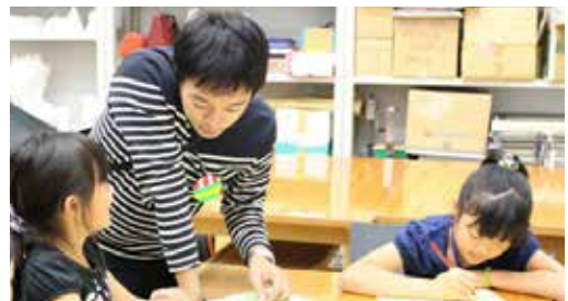
事前ワークショップの様子