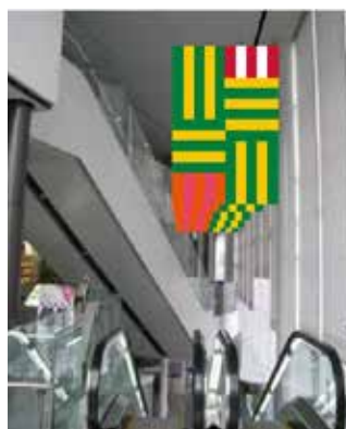
バナー掲出イメージ図（掲出時期未定）