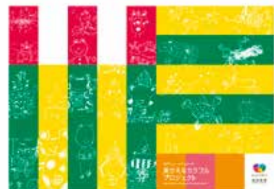
ワークショップの成果物が掲載された壁面装飾