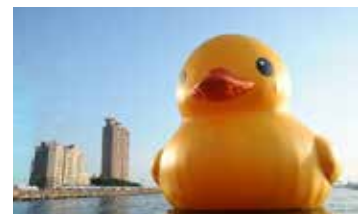
ラバーダック (Rubber Duck)

ラバーダックの作者としても知られるオランダのアーティスト、フロレンティン・ホフマンにより、2011 年に兵庫県立美術館の屋上に設置された高さ約 8m、幅約 10m のカエルのオブジェ。美かえるという名前は 700 件を超える応募の中から、「かえる」という言葉が復活をイメージしやすく、阪神・淡路大震災からの文化復興のシンボルとしての美術館の設立趣旨と合うことや、「見かえる」「見にかえる」といった語呂のよさなどから決定。今回、ホフマン氏より本プロジェクトへの協力を得られ、特別に美かえるカラーの使用を承認いただいています。