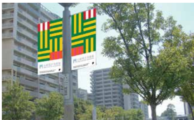
フラッグ設置イメージ図