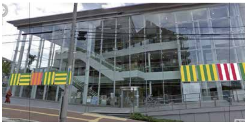
バナー掲出イメージ図（掲出時未定）