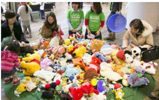
かえっこバザールイメージ