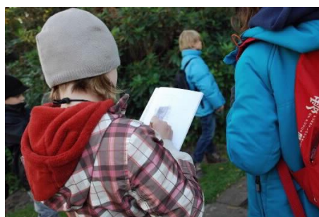
子どもが自分の街を探検し、発信する 「C my city!」の様子 (ユタカナと Arkki の協働プロジェクト)