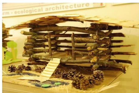
環境づくりのための知恵と手段を学ぶ 建築学校 Arkki のワークショップ