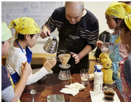
コーヒー指導の様子