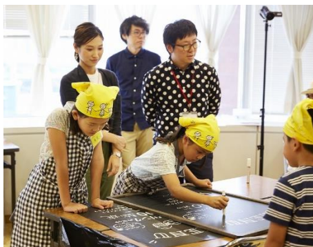
デザイン作業の様子