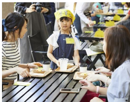
カフェ店員として働く様子

お問合せ | デザイン・クリエイティブセンター神戸 広報担当 住所 | 兵庫県神戸市中央区小野浜町 1-4