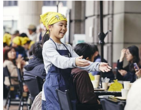
カフェ店員として働く様子