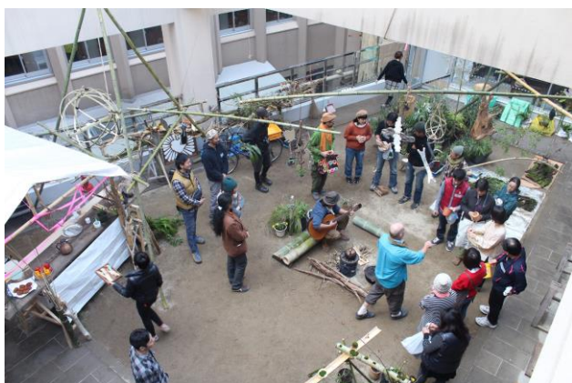
これまでの中庭ワークショップの様子

ワークショップでは、現状の中庭の整備のため、草引きや剪定、植物の植え替えを体験いただくほか、身近な食べものや環境について考えるために、生ごみや落ち葉をたい肥としてリサイクルする「コンポストづくり」や、中庭の環境に適した野菜づくりとして「キノコの原木栽培」を行います。プログラムを通して、対話、協働を生み出すコミュニティづくりを行い、公共の場の活用を市民とともに広く考えていきます。