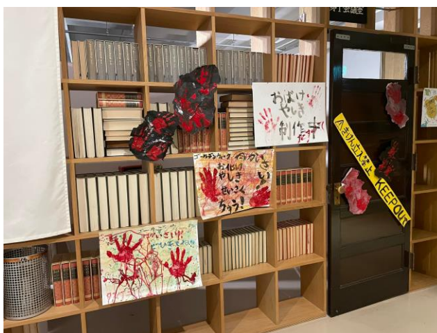
お化け屋敷の外観