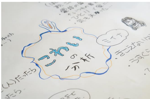
ストーリーづくりのためアイデア出し