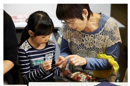
ちびっこうべ2018でのワークショップ風景