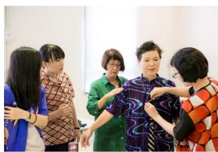
大人の洋裁教室 (2017年) の開催風景