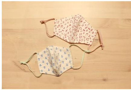
今回制作するマスクのイメージ