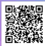
Photo Studio 人色～toiro～