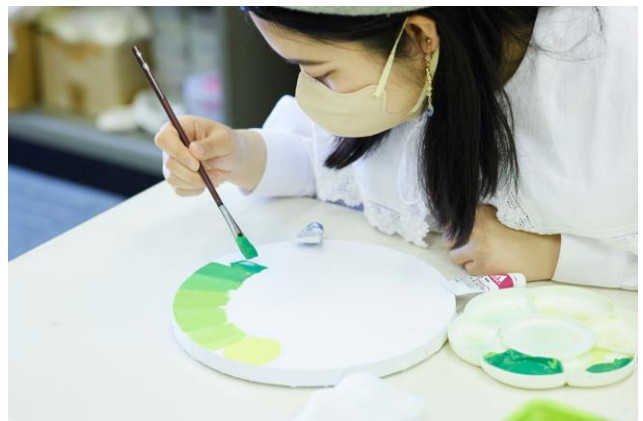
ラボワークショップの様子