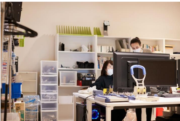
オープンラボの様子

港まち神戸を愛する会のガイドのもと、館内を巡りながら建物の歴史や意匠をご紹介します。