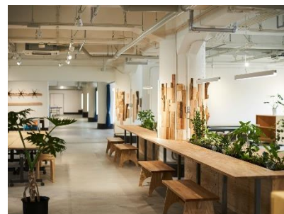
ワークショップ会場となる KIITO:300