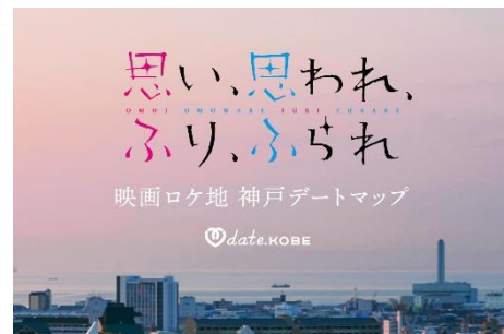
映画とのコラボレーション

お問合せ | デザイン・クリエイティブセンター神戸 広報担当 住所 | 兵庫県神戸市中央区小野浜町1-4