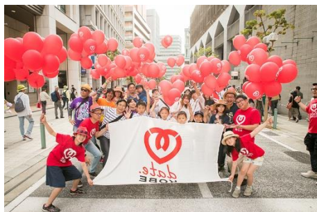
神戸まつりパレード参加の様子

市民の方々はもちろん、観光施設、公共交通機関、メディア、商業施設、商店街、ホテルなど多様なステイクホルダーが力を合わせ、デートというテーマを通じた神戸での文化の醸成に継続的に取り組んでいくことを目指しています。 https://datekobe.net/