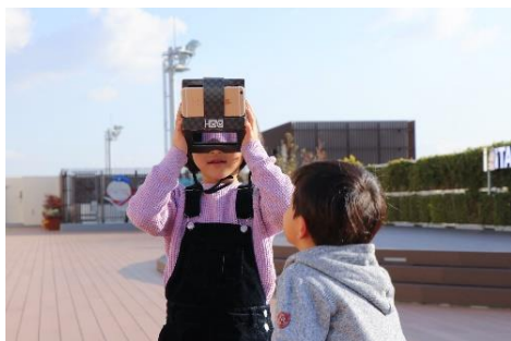
だんグラ Kids を使用して MR 体験する様子

MRとは、Mixed Realityの略で、日本語では「複合現実」と呼びます。現実世界にデジタル映像を投影するAR（拡張現実）や、デジタル映像の中に入り込んだような体験ができるVR（仮想現実）とは異なり、現実世界の中に仮想世界の情報や映像が投影され、それらを自分の手で操作するような体験ができます。