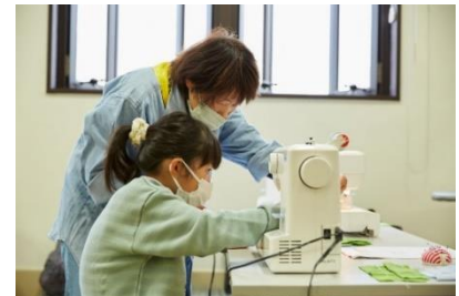
ちびっこうべ「洋裁工房」(2022年)