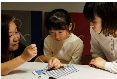
ちびっこうべ「洋裁工房」(2018年)