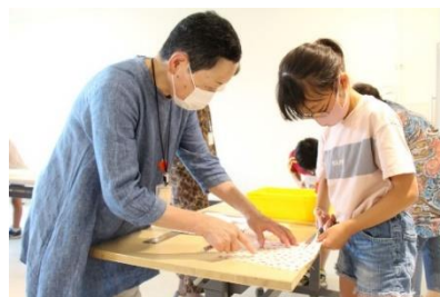
「子ども洋裁教室 洋裁マダムとマスクをつくらう」(2022年)