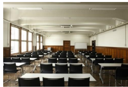
写真左：外観/中：KIITO ホール/右：会議室 303