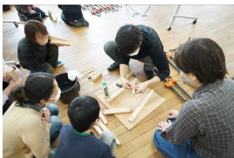
⑪ ペーパーコードの座編みスツール