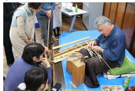
⑤ 有馬籠のフラワーベース