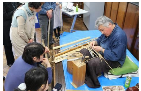
⑤ 有馬籠のフラワーベース