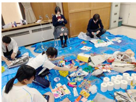
関西学院高等部3年生の 大漁の材料でつくるアート探究授業