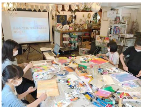
「抽象的」とはどのようなことか？をテーマに抽象画を描く小学生向けのワーク