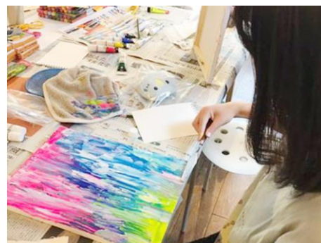
答えがない中で自分の中の感性を元に自己決定していく抽象画ワーク