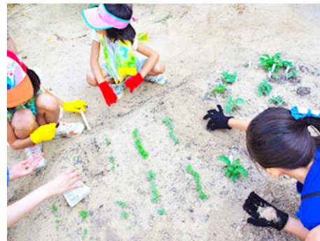
「種から育てる料理教室」 子どもたちが野菜を収穫する様子