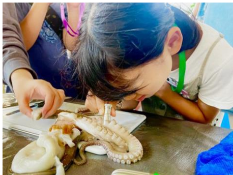
「かまくらULTLAプログラム」 タコの解剖から命をいただくまでの様子