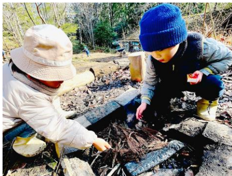
奈良県保育者向けワークブック「ひとたね」 森のようちえんで火おこしをする様子